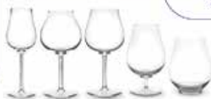
Verres Paris Bouquet - Peugeot