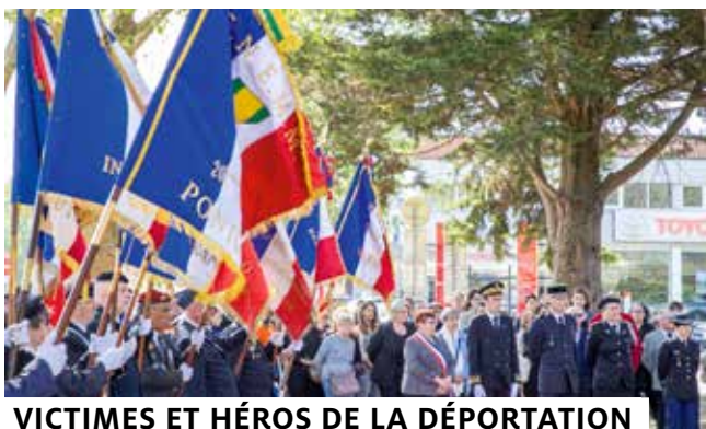
VICTIMES ET HÉROS DE LA DÉPORTATION

À l'occasion de la Journée internationale des droits des femmes, le 8 mars, la Ville a fait entendre la voix de l'égalité femmes-hommes à travers de nombreuses actions sur l'espace public ainsi qu'au sein des établissements accueillant du public. ●