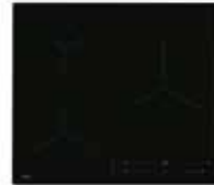
Plaque de cuisson Induction SaphirMatt® AEG