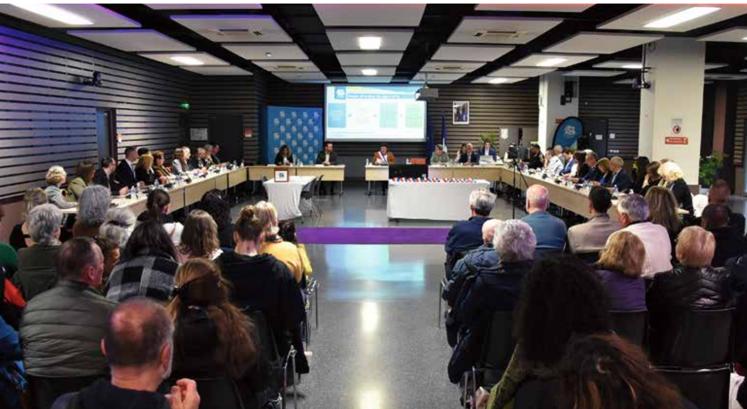
Conseil municipal d'installation du 28 mars 2026.

fil rouge du nouveau mandat, nous allons engager très vite des travaux liés aux économies d'énergie dans les bâtiments municipaux. Enfin l'autre axe fort de ce début de mandat portera sur les services aux familles avec par exemple l'augmentation du nombre de places en centre de loisirs qui sera notamment rendue possible grâce à la reconstruction et l'extension du bâtiment périscolaire de Flammarion. Une réflexion doit également être lancée rapidement autour de la question de l'augmentation du nombre de places en crèche.