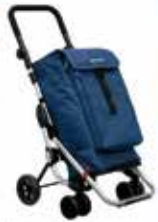
Poussette de course Playmarket

Réparation à domicile ou en atelier | Service antenne | 300 m 2 d'exposition