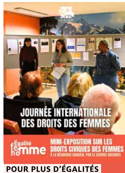
POUR PLUS D'ÉGALITÉS

Il va permettre à la structure de financer plusieurs projets, dont un séjour thérapeutique, au bénéfice des enfants accompagnés. ●