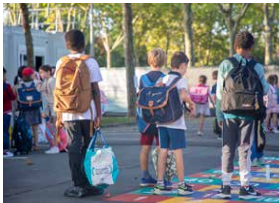
Le 2 septembre, jour de rentrée, madame la Maire et son adjointe à l'Éducation sont allées à la rencontre des enseignants, des enfants et des parents.