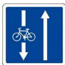
C 24 a