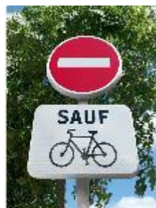
B1 et M 9v2